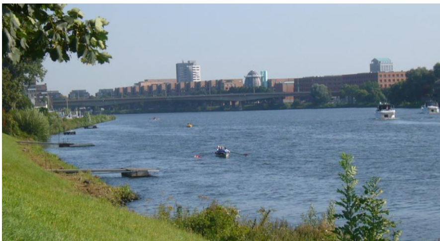
De start van de MnM roeitocht in Maastricht